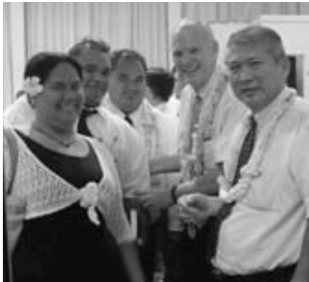
Des jeunes adultes ravis de leur veillée

Dimanche soir 16 septembre, plus de trois cent jeunes de l'institut de religion des cinq pieux se sont réunis à Fariipiti, pour écouter Charles W. Dahlquist, président général des