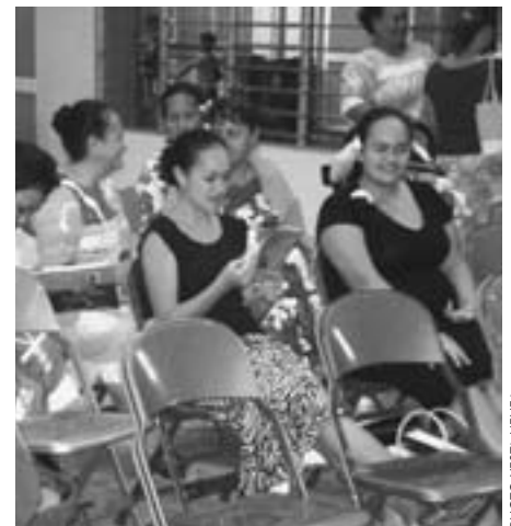
Contentes de se retrouver

parler de ses qualités. Nous avons pu découvrir que l'amour du Christ était présent et qu'il continuera de nous guider en ces derniers jours, dans ce monde difficile.