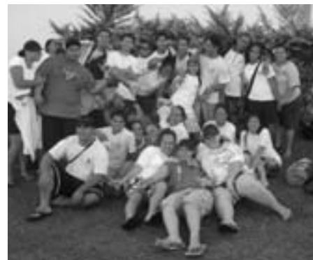
Les J.A. ravis de se retrouver à Taravao

Différents ateliers étaient proposés pour répondre aux objectifs fixés. Les cadres, les animateurs et les