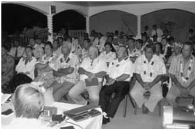
Membres et amis de la Branche de Arutua et Apataki pendant la soirée du vendredi 29 août 2008