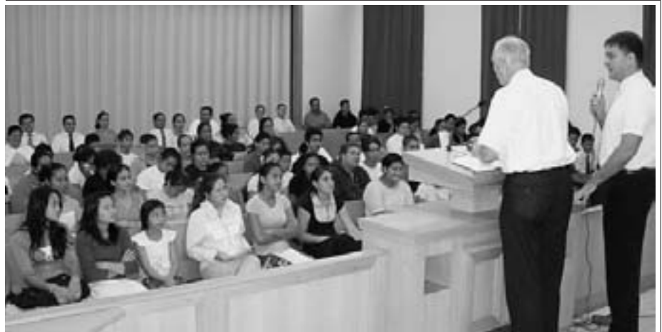
« Porter constamment les armes du Seigneur »

Il appela ses voisins, leur disant de venir avec des pelles et les voilà en train de reboucher le fossé. Mais soudain l'âne brailla et le fermier, étonné, décida de regarder dans le trou. À sa grande surprise, l'âne s'ébrouait et secouait la terre à chaque pelletée qu'on jetait dans le fossé, si bien qu'au lieu d'être enseveli, il finit par remplir le fossé, à remonter et à en ressortir. Quelle leçon allons-nous retenir ? Chaque fois que nous aurons des épreuves ou des difficultés dans la vie, nous devrions les laisser couler le long de notre corps en nous protégeant avec les armes de Dieu indiquées dans Éphésiens 6:13-17 : « ... la vérité, la cuirasse de la justice, l'Évangile de