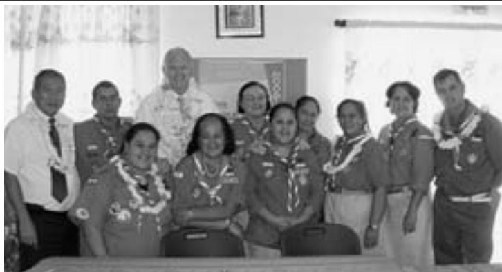
Réunion de travail avec les membres du conseil du scoutisme polynésien

La rencontre avec Monsieur Clarentz Vernaudon, Ministre de la Jeunesse et des Sports, a porté sur la situation de la jeunesse dans le pays. Un échange de cadeaux a conclu cette visite de courtoisie.