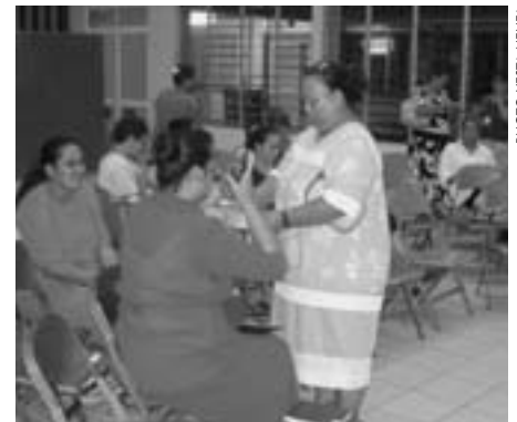
Des ateliers édifiants